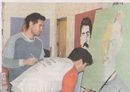
Sardine & Tobleroni é o nome da aliança entre os dois artistas

Mais informação: www.santiagoalquimista.com