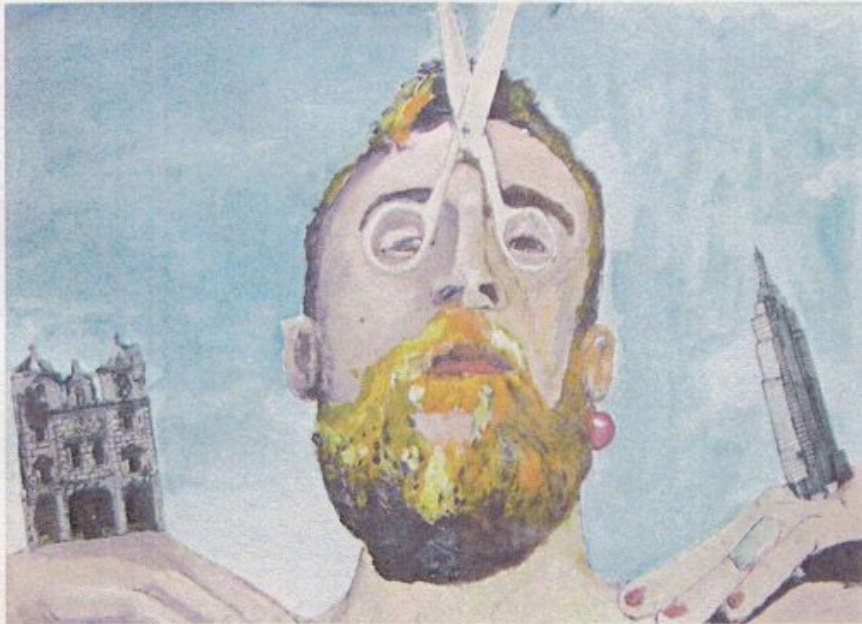
O CORPO É QUE PAGA SARDINE&TABLERONI

O carismático cantor António Variações é um dos homenageados nesta exposição da dupla de artistas Victor Silveira e Jay Rechsteiner, residente em Londres